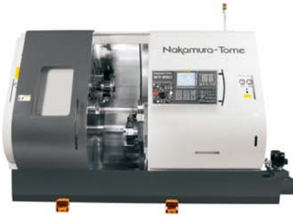
Super Mill WY-250