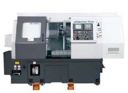
Super Mill SC-200L